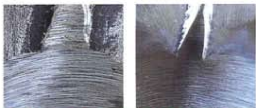
弊社フレキシブル砥石#36 削れるディスク#36